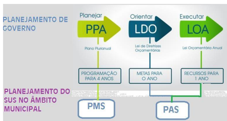
Figura 04. Premissas para o planejamento em saúde, Porto Velho/RO, 2024.